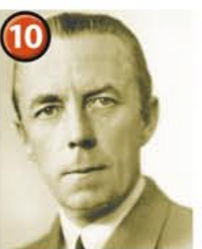
Folke Bernadottes park

Hette tidigare Södra Trädgårdsgatan men döptes om 1948 efter Hugo Hamilton (1849-1928) som var landshövding 1900-1918.