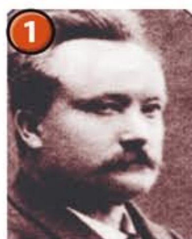
Olof Danielssons gata