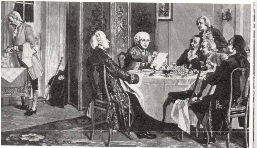
Kant inbjuder till bordssamtal och läsecirklar

Filosofen Immanuel Kant (1724-1804) är den moderna tidens Sokrates. Han dog den 12 februari 1804. Hans fader var sadelmakare och pietist. Han firas på sin 200 årsdag över hela världen. Han ansågs av sin samtid kontroversiell med sitt upplysningspatos. En intellektuell som smular sönder alla förlegade föreställningar med sin kritik . Och hur förstår Kants kritikbegrepp eller Kritiker ?